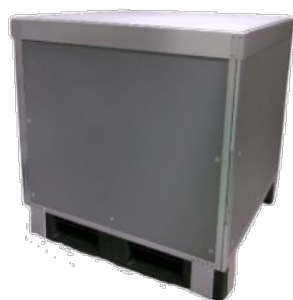
ダンサーモテスト結果

※ダンサーモの手配・回収については、距離・地域により料金が異なるためTRANCOMにお問い合わせください。